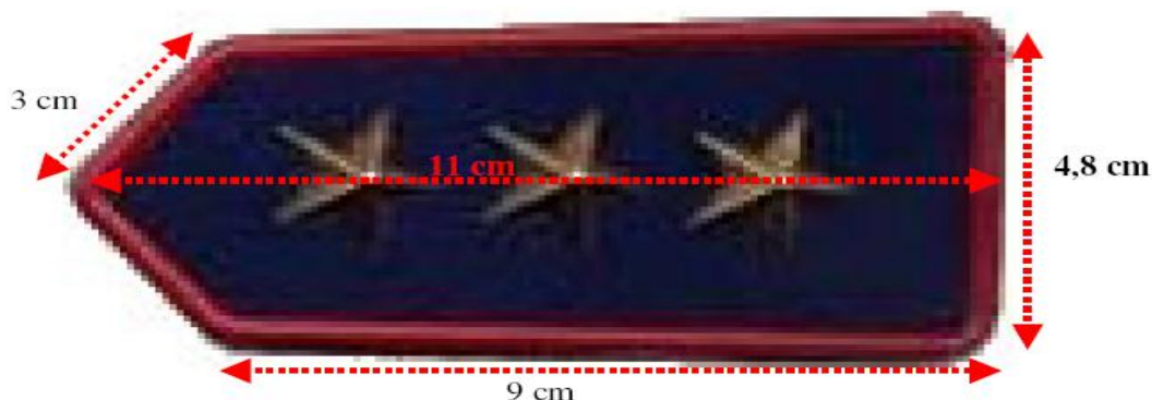
Fig. 1 (il grado riportato in figura è solo a titolo indicativo)